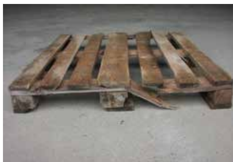
Příčně polámaná paleta