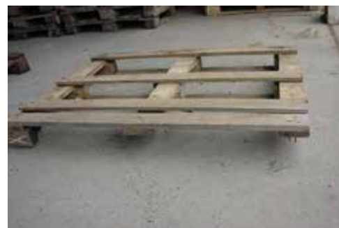
Chybějící laty a hranoly

V případě nutnosti rozebrání nastohovaných palet z důvodu vynětí poškozených palet je vykupující oprávněn účtovat manipulační poplatek ve výši 50 Kč za každou paletu, se kterou bylo takto manipulováno.